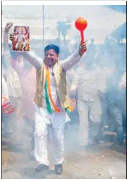
कांग्रेस की जीत पर कार्यकर्ता बजरंगबली का गदा लेकर खुशी मनाते हुए।